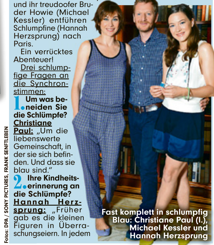
Fast komplett in schlumpfig Blau: Christiane Paul (l.), Michael Kessler und Hannah Herzprung

3. Wie weit identifizieren Sie sich mit Ihrem Schlumpf? Michael Kessler: „Ich spiele mich wieder selbst. Meine Rolle ist öfter mal der Trottel.“ tre